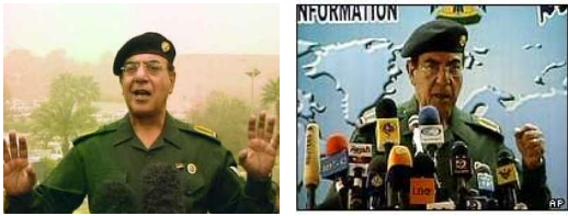
Beeldfragment 22-04: Comical Ali