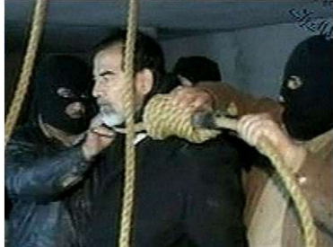
Beeldfragment 22-05: executie van Saddam Hoessein

=> 30 december 2006: Saddam wordt opgehangen