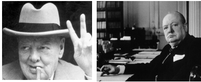
Beeldfragment 10-04: Iron Curtain speech van Churchill